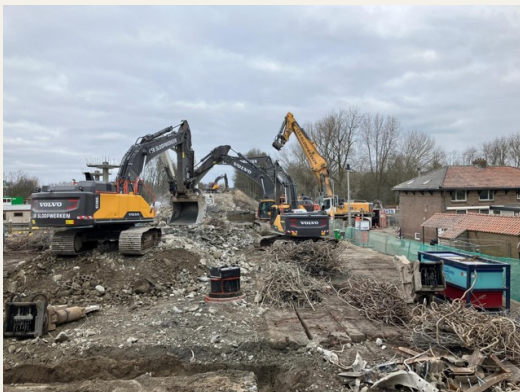
Onze bouwplaats tijdens de sloop aan de Nieuwemeerdijk

Verder blijven de huidige omleidingen in gebruik tot het moment dat we de brug weer openstellen (eind augustus).