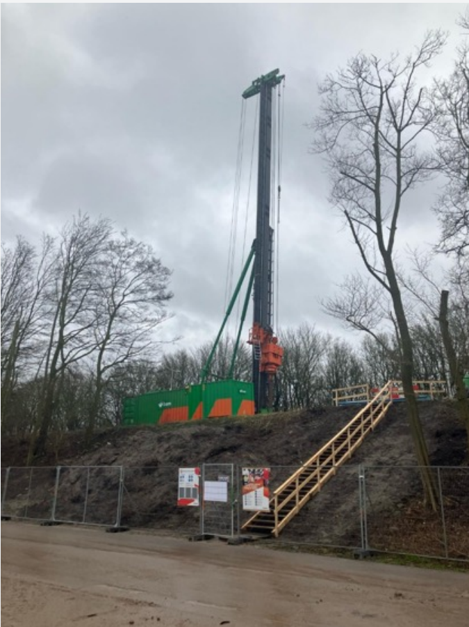
De stelling die de palen in de grond boort

Een gespecialiseerde partij heeft samen met de Explosieven Opruimingsdienst (EOD) het duiken, het vervoeren en het op een andere locatie tot ontploffing brengen van de munitie gecoördineerd. Dit gebeurde in nauwe samenwerking met het projectteam. Nadat een gedeelte van de bodem van de Ringvaart munitievrij werd verklaard, konden wij op dat gedeelte starten met de sloop.