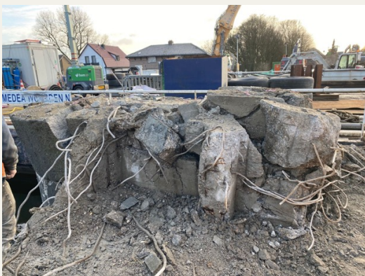
Vrijgekomen stukken van de oude brug. De wapening is goed zichtbaar tussen het beton.