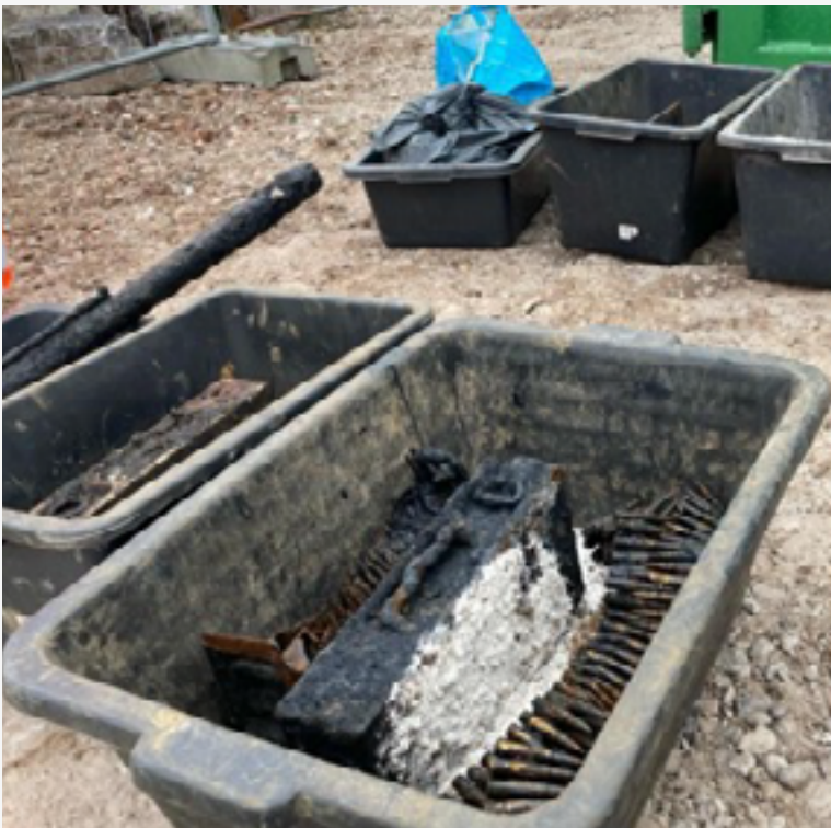
Een deel van de gevonden munitie

Tijdens het baggeren werd munitie gevonden. Diverse kogelpatronen en een landmijn kwamen van de bodem van de Ringvaart. Het baggeren is toen stilgelegd. Samen met een gecertificeerd onderzoeksbedrijf hebben we een plan van aanpak gemaakt. Het was namelijk niet veilig om zonder maatregelen verder te baggeren. Vanaf de eerste week van januari zijn er duikers in de Ringvaart aan het werk. Zij zoeken de bodem af op zoek naar munitie. Inmiddels zijn er al diverse landmijnen, handgranaten en (dozen met) patronen gevonden.