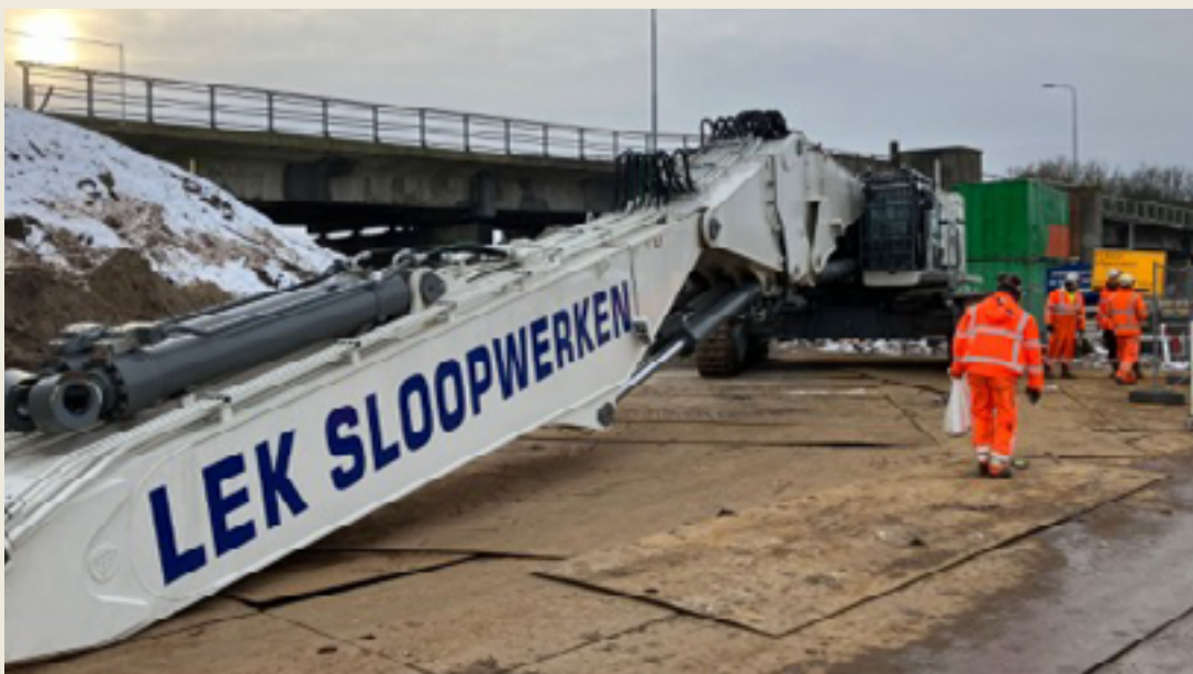
Afgelopen week is één van de sloopkranen aangevoerd. De kraan staat op de Oude Haagseweg

Bij de sloop van de brug zetten wij vijf sloopkranen in. Vrijwel al ons bouwverkeer rijdt via de busbaan naar ons werkvak. Aankomende dinsdag 23 januari moet er één sloopkraan met twee transporten via de Nieuwemeerdijk (vanaf de rotonde bij Schiphol/A9) rijden om het werkvak te bereiken. Dit is nodig, omdat de sloopkraan alleen op die manier bij de opstelplaats kan komen. Deze kraan kan niet vanaf de busbaan naar de Nieuwemeerdijk. Wij zorgen dat de twee transporten over de Nieuwemeerdijk stapsvoets rijden. Zo voorkomen we het risico op schade aan de aangrenzende woningen.