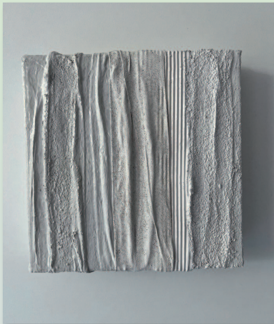
FRANK VINCENT STALEN SCULPTUREN

De tentoonstelling wordt geopend op zondag 18 juni 2023 om 16.00 uur