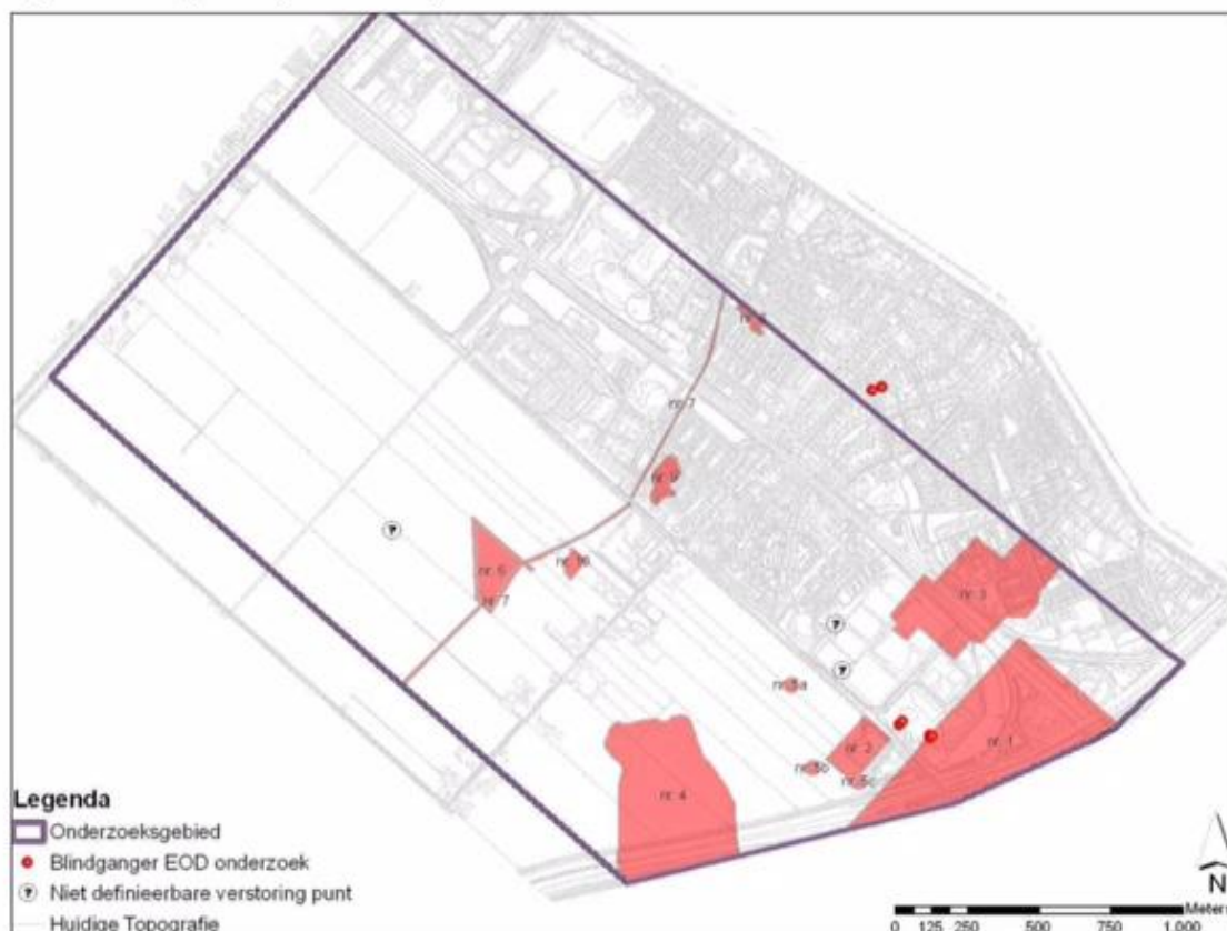
Figuur 4.2: Begrenzing verdachte gebieden