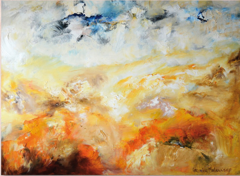
VERONICA MOLENKAMP OLIEVERF SCHILDERIJEN

Van vrijdag 14 februari tot en met zondag 22 maart 2020 De tentoonstelling wordt geopend op zondag 16 februari om 16.00 uur