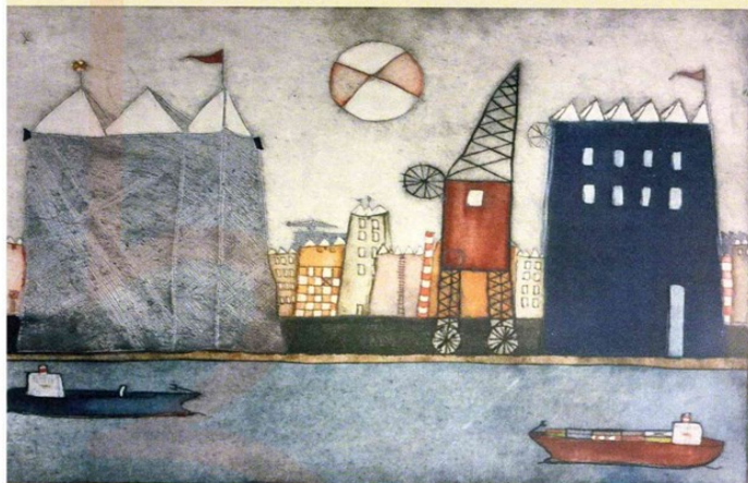
MARJAN SMIT GRAFIEK EN GLAS