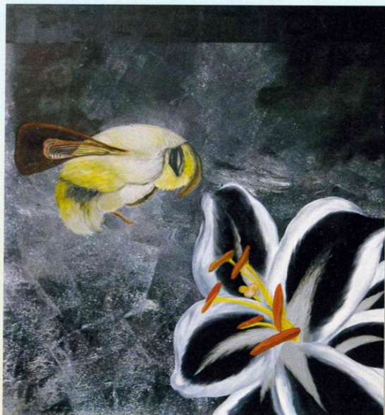
MARIASOLE LIZZARI SCHILDERIJEN

Van vrijdag 3 mei tot en met zondag 2 juni 2019