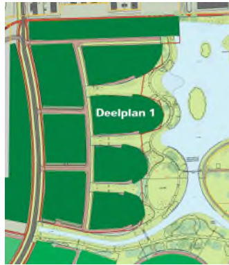
2. 6 jarenplan