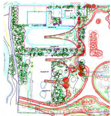
3. kap augustus 2017

Verbeelding 3. toont de te kappen bomen in augustus 2017 omdat men in maart en juli 2018 denk te beginnen met realisatie. Het is niet duidelijk hoe, wanneer en in welke omvang dat gaat gebeuren.