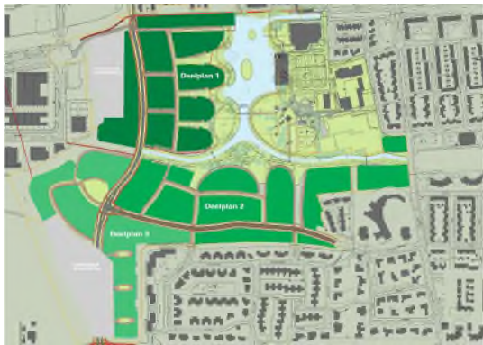
1. 10 jarenplan